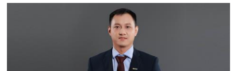
Chuyên viên cao cấp phân tích